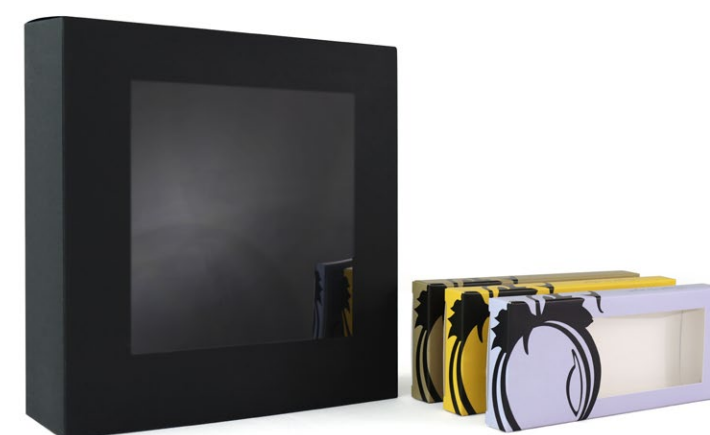
Scatole ed Astucci con finestra