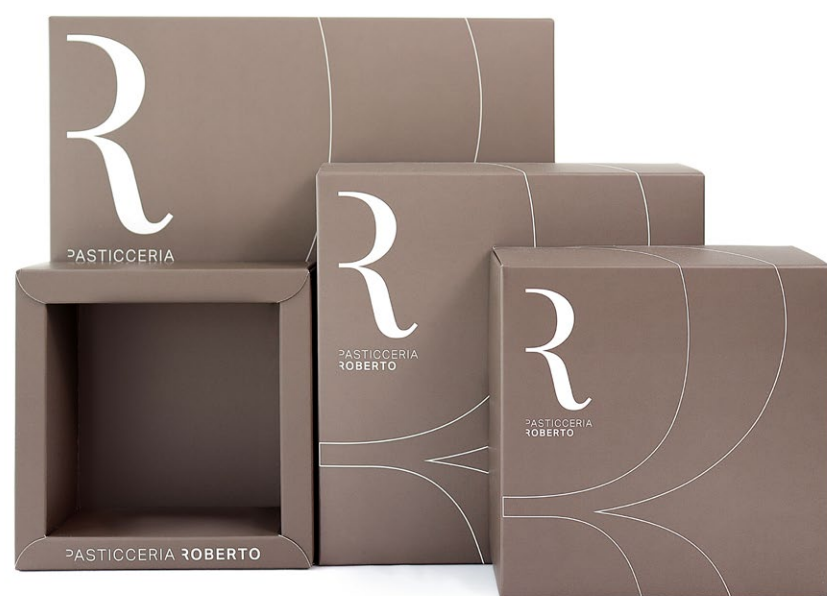
Scatole ed Astucci in cartone teso