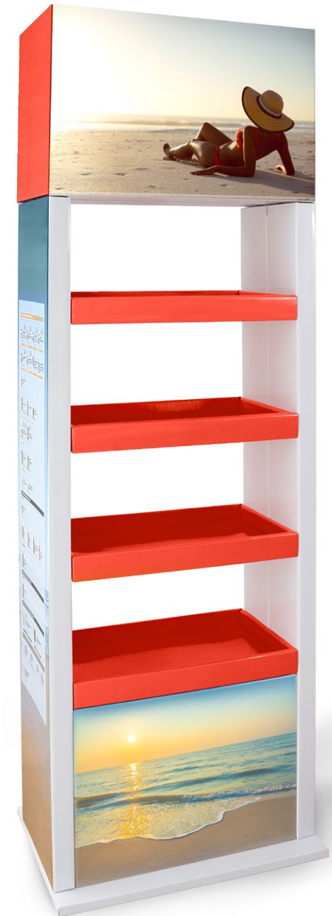
Expo e Display da terra