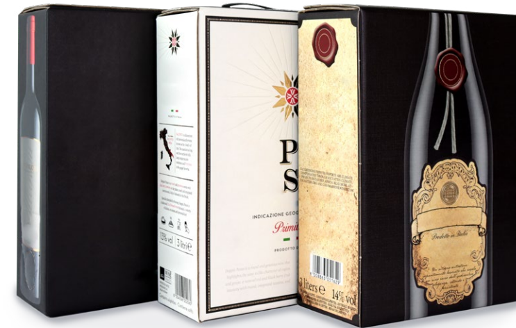
Scatole Bag in Box (con maniglia)