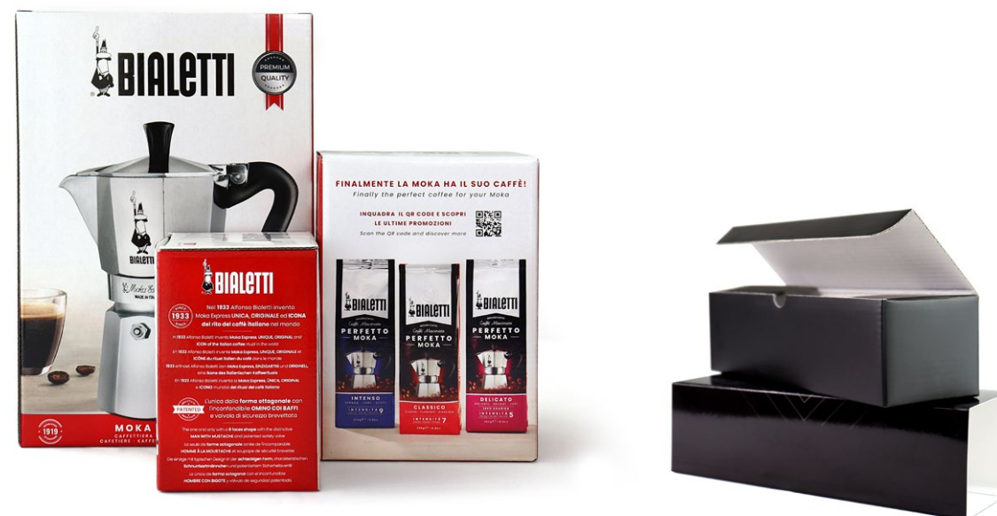
Scatole ed Astucci in microonda

Il nostro successo è il risultato di una cultura aziendale basata sulla serietà e la professionalità, unita a una continua ricerca dell'eccellenza e all'utilizzo delle tecnologie più avanzate. L'azienda si distingue per la qualità dei suoi prodotti , l'affidabilità dei suoi servizi e la cura che dedica alla soddisfazione del cliente .